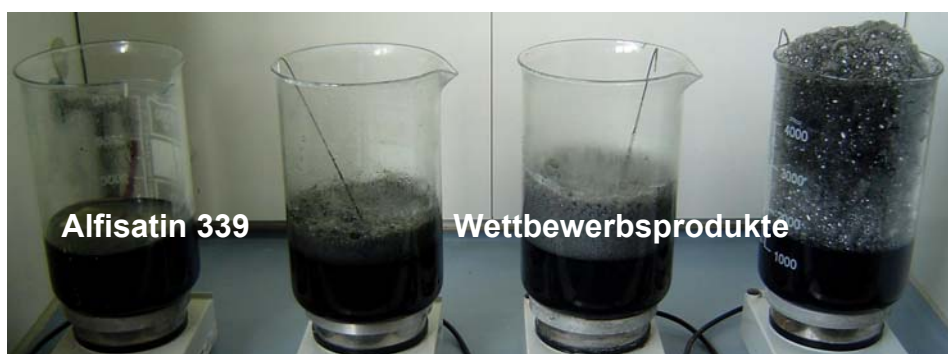
nach 20 min

[Versuchsbedingungen: NaOH 70 g/l, Al 180 g/l, Additiv 30 g/l, Temp. 50°C, Al-Oberfläche 2 dm 2 ; identische Bedingungen für alle Testansätze]