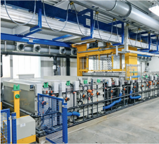
Neueste vollautomatische Anlage zum Anodisieren von Aluminium